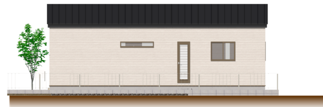
● 東側 立面図