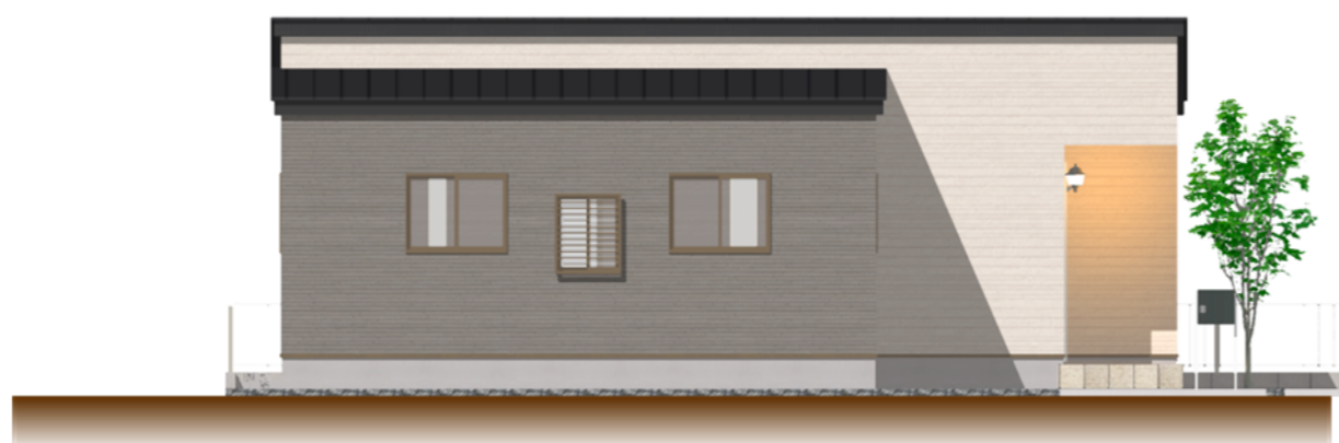
● 西側 立面図