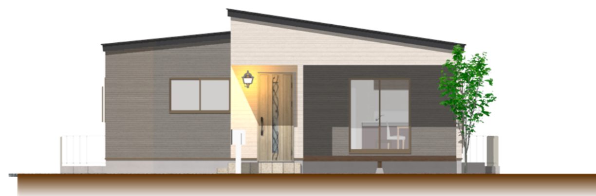
● 南側 立面図